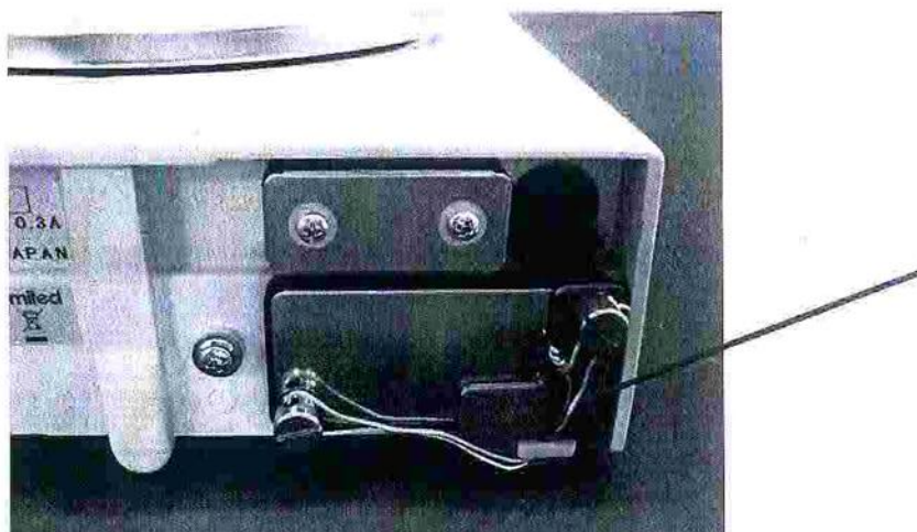
Рисунок 2 – Схема пломбировки весов

Схема пломбировки весов от несанкционированного доступа приведена на рисунке 2.