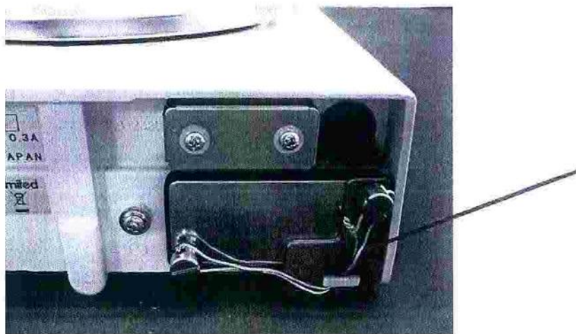
Рисунок 2 – Схема пломбировки весов

Схема пломбировки весов от несанкционированного доступа приведена на рисунке 2.