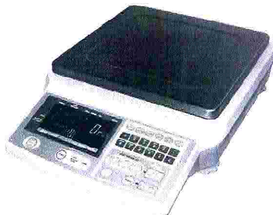
Рисунок 1 – Общий вид весов

Общий вид весов представлен на рисунке 1.