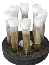
SV-8/15 BS-010210-ДК платформа

Для 10 пробирок с внешним диаметром 12 мм (10 мл).