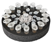
SV-16/8 BS-010210-СК платформа

Для 16/8/8 пробирок с внешним диаметром 11/8/6 мм (1.5/0.5/0.2 мл).