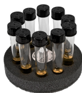
SV-10/10 BS-010210-ВК платформа

Для 16/8/8 пробирок с внешним диаметром 11/8/6 мм (1.5/0.5/0.2 мл).