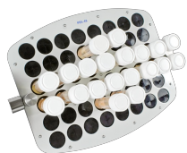
PRS-48 BS-010118-CK платформа

14 пробирок диам. 20-30 мм (50 мл пробирки).