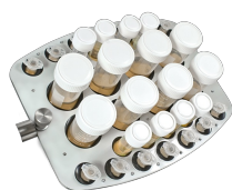
PRS-8/22 BS-010118-AK платформа

48 пробирок диам. 10-16 мм (1.5-15 мл пробирки).