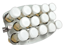
PRS-14 BS-010118-BK платформа

14 пробирок диам. 20-30 мм (50 мл пробирки).