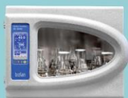
ES-20/80 Орбитальный шейкер