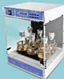
Применение: • Агглютинация • Окрашивание геля