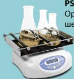
ES-20, Орбитальный шейкер-инкубатор