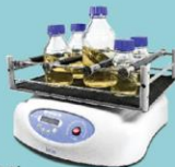
PSU-20i, Орбитальный шейкер