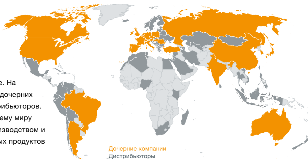
Дочерние компании Дистрибьюторы

Головной офис нашей компании находится на юге Германии, в Шварцвальде. Концерн Testo AG в течение многих лет расширяет свое присутствие на мировом рынке. На данный момент у компании 30 дочерних предприятий и свыше 80 дистрибьюторов. Около 2500 сотрудников по всему миру занимаются разработкой, производством и продажей высокотехнологичных продуктов компании.