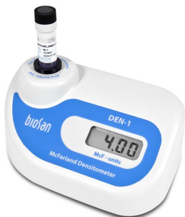
DEN-1 BS-050102-AAF Денситометр

Денситометр DEN-1 предназначен для измерения мутности клеточных суспензий в пределах диапазона 0,0–6,0 единиц МакФарланда (McF) ( 0 - 180 \times 10^7 клеток/мл).