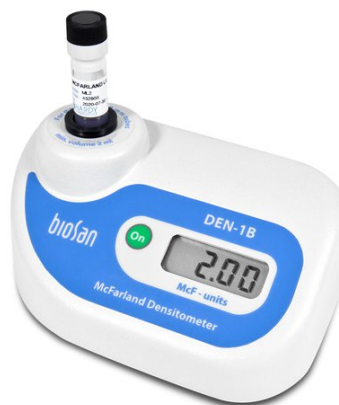
DEN-1B BS-050104-AAF Денситометр

Денситометр DEN-1B предназначены для измерения мутности клеточных суспензий в пределах диапазона 0,0–6,0 единиц МакФарланда (McF) ( 0 - 180 \times 10^7 клеток/мл).