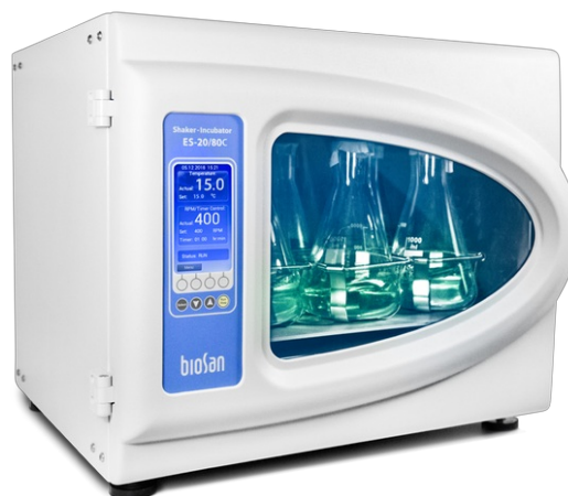
ES-20/80C Software included, without platform Шейкер-инкубатор с охлаждением