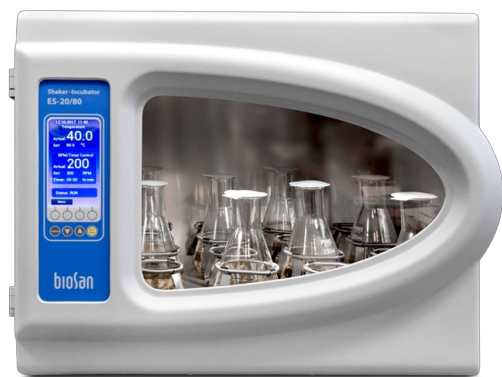
ES-20/80 Software included, without platform Шейкер-инкубатор