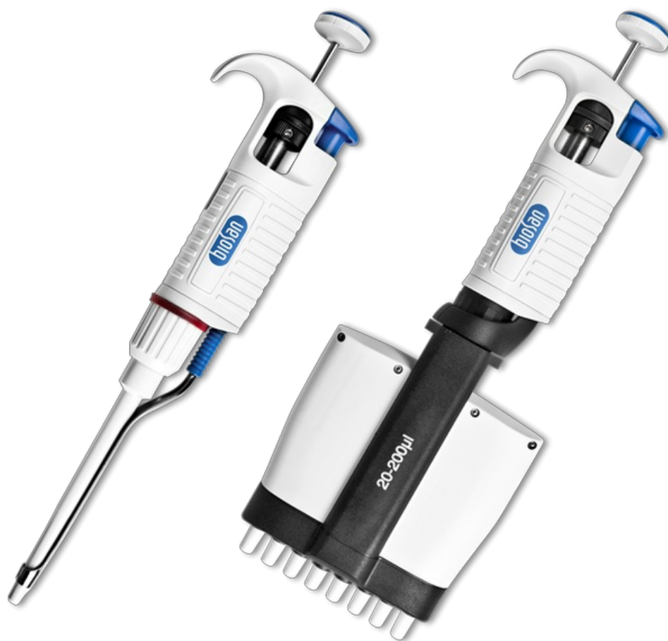
Assist Adjustable volume pipettes - Single channel Серия пипеток

Серия пипеток Assist – это одноканальные и многоканальные пипетки переменного объема для дозирования жидкости в пределах от 0,1 до 10000 мкл у одноканальных, в зависимости от модели.