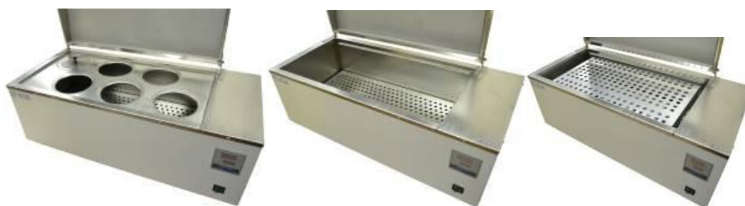
Крышка с 6 местами