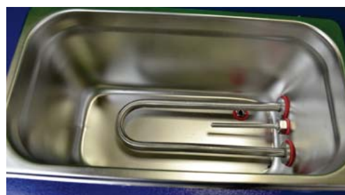
Ванна бани UT-4305