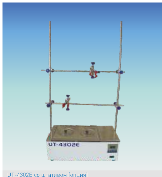
UT-4302E со штативом (опция)