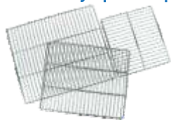
Дополнительные полки из нержавеющей стали