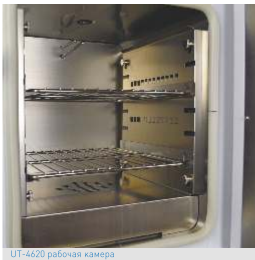
UT-4620 рабочая камера