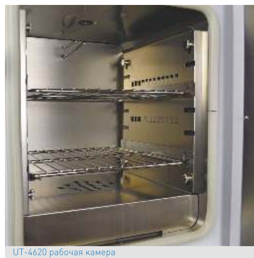
UT-4620 рабочая камера