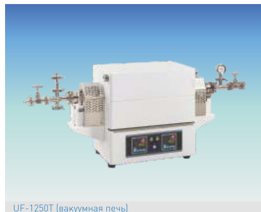
UF-1250T (вакуумная печь)