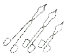
6-600-150-450 Щипцы тигельные