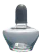
9-3-150 Спиртовка с колпачком, 150 мл