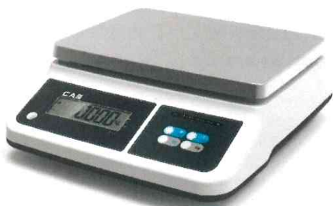
Модификация PRII-X1CD с жидкокристаллическим показывающим устройством