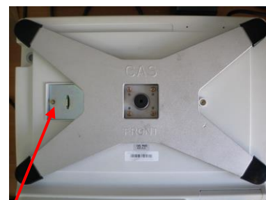
Исполнения «3000, 7000»