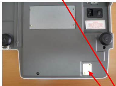
Исполнения «3000J, 3000N»