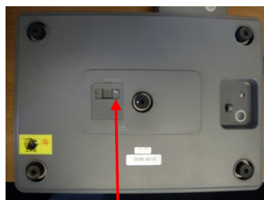
Исполнения «5000-D, 7000D»