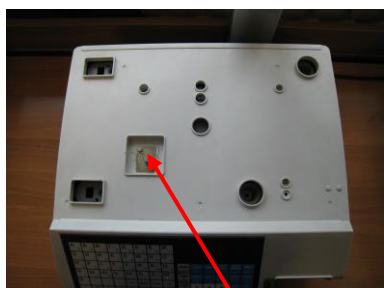
Исполнения «5000, 5000J»