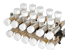
PRSC-22 BS-010117-LK платформа

10 пробирок диам. 20-30 мм (50 мл пробирки).