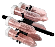
M-8/50 BS-010117-PK платформа

10 пробирок диам. 25-30 мм (50 мл пробирки).