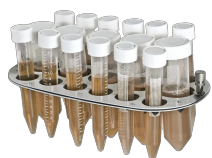
PRS-5/12 BS-010117-HK платформа

5 пробирок диам. 20-30 мм (50 мл пробирки) и 12 пробирок диам. 10-16 мм (1.5- 15 мл пробирки).