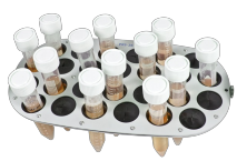
PRS-26 BS-010117-GK платформа