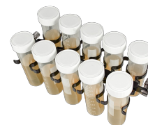
PRSC-10 BS-010117-LK платформа

10 пробирок диам. 25-30 мм (50 мл пробирки).