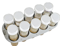
PRS-10 BS-010117-IK платформа

5 пробирок диам. 20-30 мм (50 мл пробирки) и 12 пробирок диам. 10-16 мм (1.5- 15 мл пробирки).