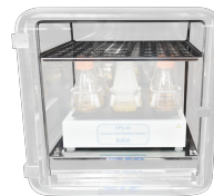
RS2 BS-010425-HK штатив для установки CPS-20