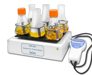
CPS-20 Without platform CO 2 Шейкер