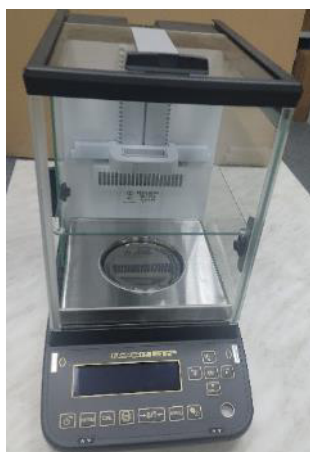
Общий вид модификации ВЛА-xxxМА (исполнение с автоматизированной витриной и регулируемым по высоте внутренним ветрозащитным экраном)