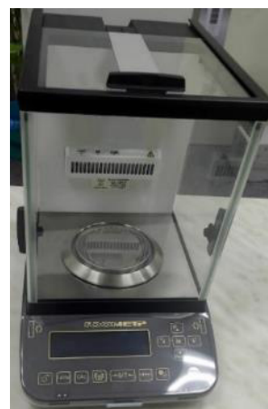
Общий вид модификаций ВЛА-220С-ОА, ВЛА-320С-ОА (исполнение с автоматизированной витриной)