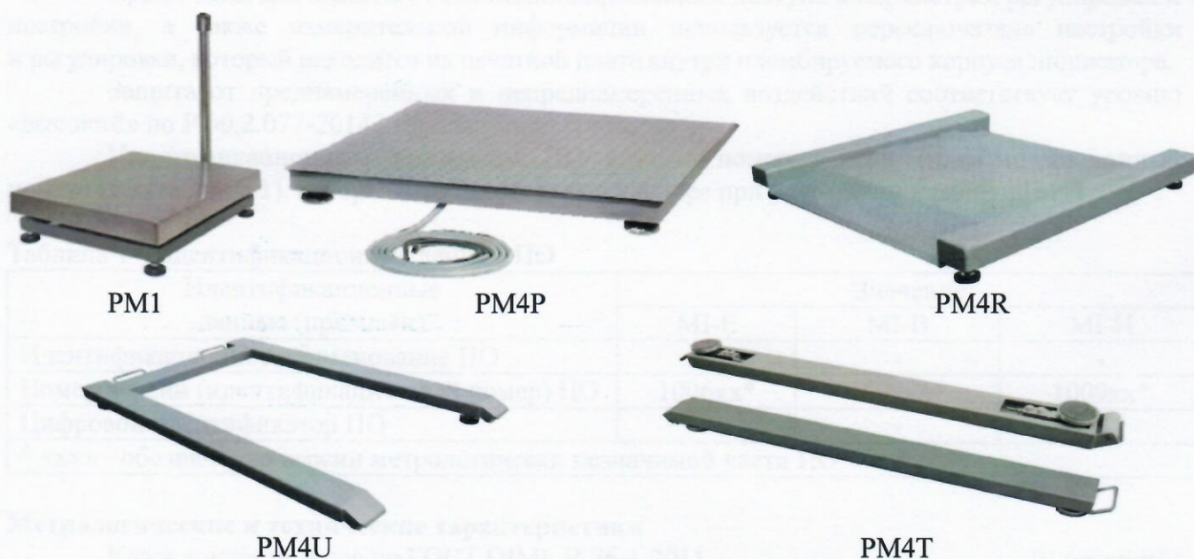
Рисунок 1 - Общий вид ГПУ весов

Схема пломбировки от несанкционированного доступа, обозначение места нанесения знака поверки представлены на рисунке 3.