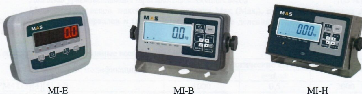
Рисунок 2 - Общий вид индикаторов