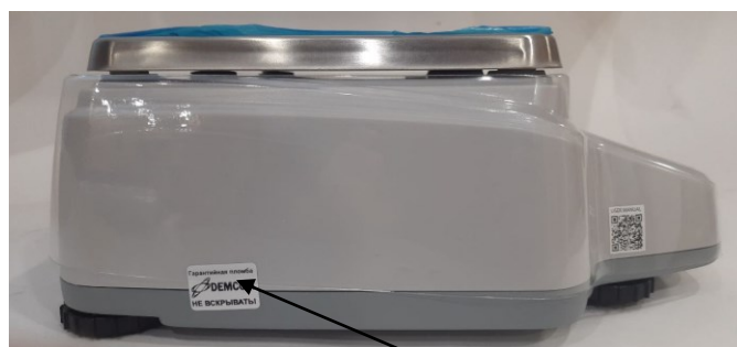
Рисунок 1 – Общий вид весов