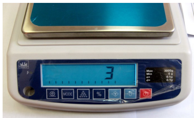
Рисунок 1 - Индикация кода юстировки