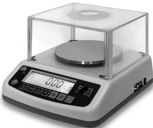
Рисунок 3 – Общий вид весов