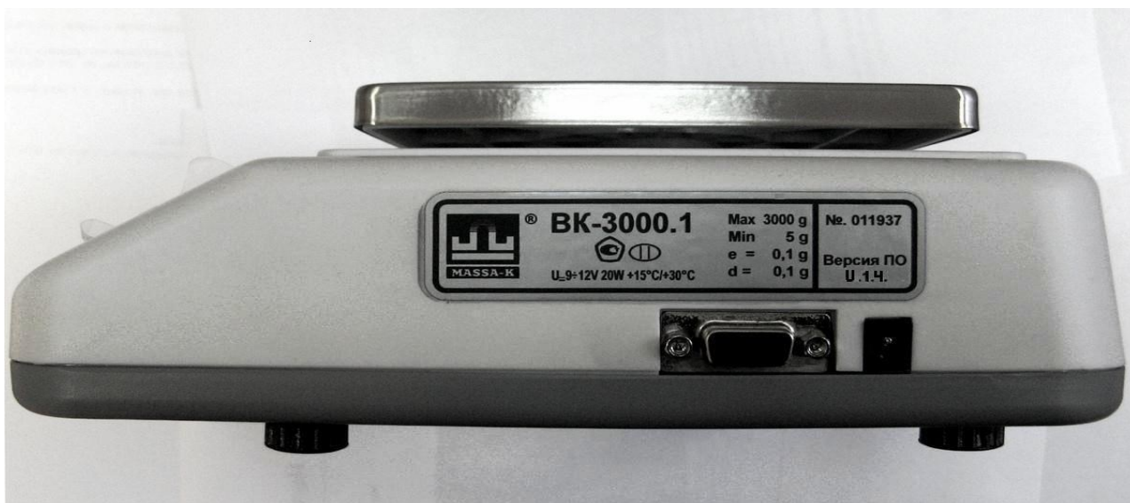
Рисунок 4 – Общий вид весов. Маркировка весов

Маркировка весов производится на фирменной, разрушающейся при снятии, пластине (Рис. 2), на которой нанесено: